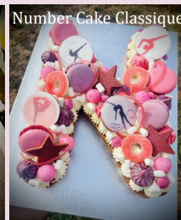
Number Cake Classique