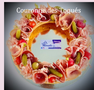
Couronne des Toqués