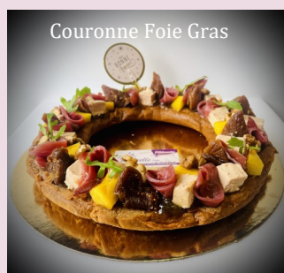
Couronne Foie Gras