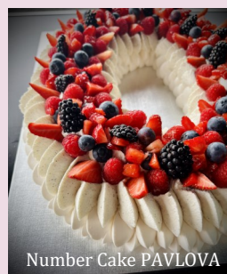
Number Cake PAVLOVA