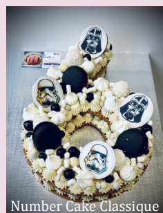
Number Cake Classique