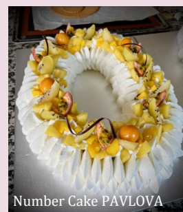
Number Cake PAVLOVA