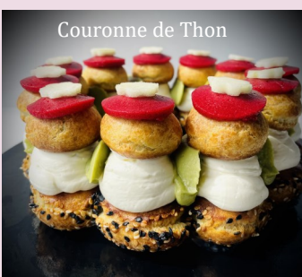
Couronne de Thon