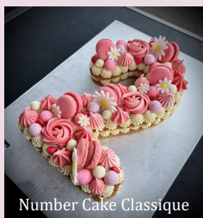
Number Cake Classique